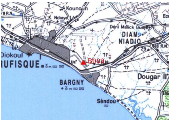
Cartographie 1:200.000 : Dakar

Description: stade de Bargny, borne posée à l'intérieur de l'enceinte du stade au Nord-Ouest des tribunes