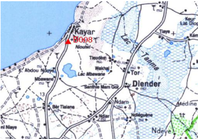
Cartographie 1:200.000 : Dakar

Description: Kayar, borne béton dans l'angle Ouest de la cour de la Gendarmerie