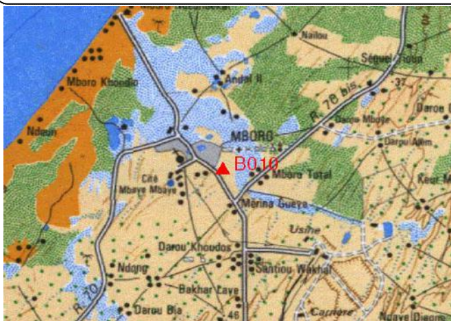
Cartographie 1:200.000 : Louga

Description: M'Boro, borne béton située près de l'angle Est du terrain de sport du lycée