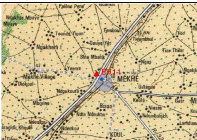
Cartographie 1:200.000 : Louga

Description: Mékhé, borne béton située dans l'angle Nord-Ouest entre le mur extérieur et le stade