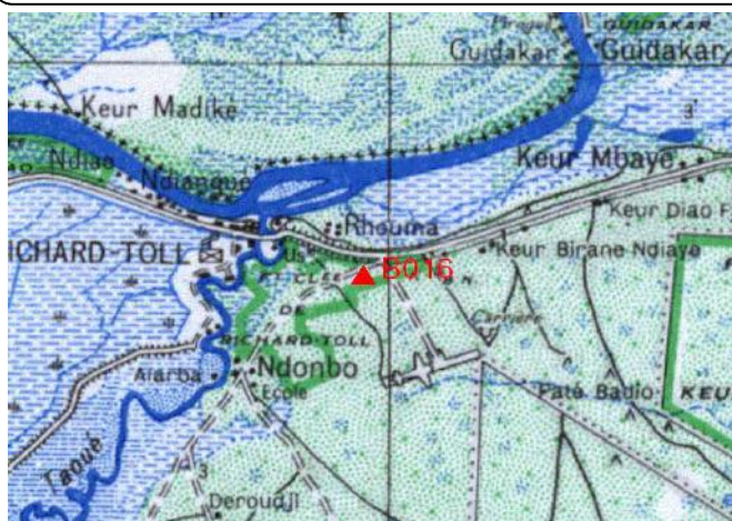
Cartographie 1:200.000 : Dagana

Description: Richard Toll, borne béton dans l'angle Sud Est de l'enceinte du lycée