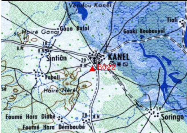
Cartographie 1:200.000 : Matam

Description: Kanel, borne béton dans l'angle Nord Est du stade de football