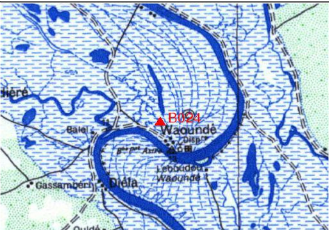
Cartographie 1:200.000 : Selibabi

Description: Waoundé, borne béton dans l'angle Sud Est de l'enceinte de l'Hôtel de Ville