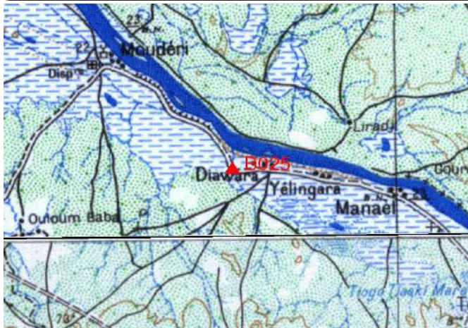
Cartographie 1:200.000 : Selibabi

Description: Diawara, borne béton dans l'angle Sud Est de l'enceinte de la Mairie