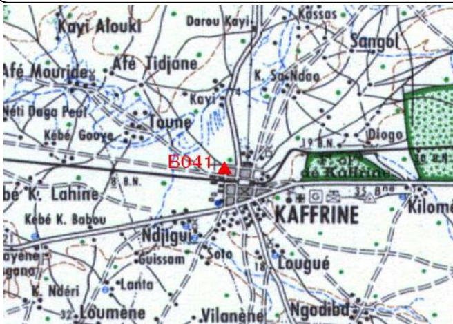
Cartographie 1:200.000 : Kaffrine

Description: Kaffrine, borne béton située dans l'angle Sud Ouest de l'enceinte du nouveau lycée