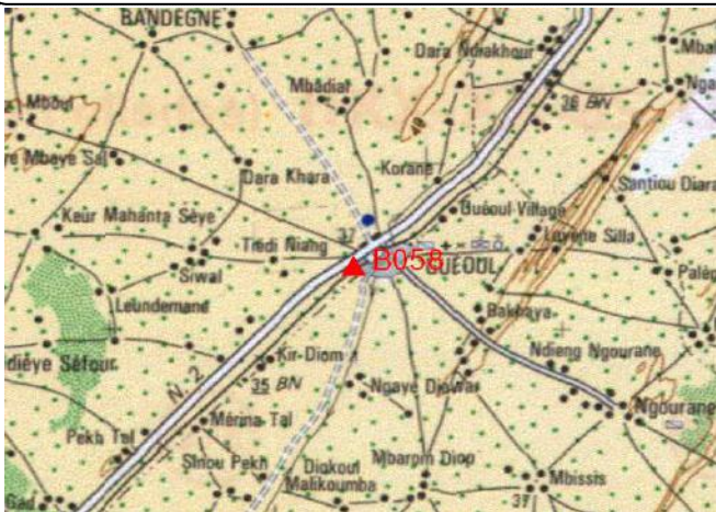
Cartographie 1:200.000 : Louga

Description: Guéoul, borne béton située au Nord des rails près de la nouvelle maison communautaire Chef du village Amadou Sylla Tel. 775781456.