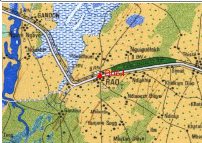
Cartographie 1:200.000 : Louga

Description: Rao, borne béton située dans l'angle Nord Est de l'enceinte du CEM, à gauche de l'entrée piétons.