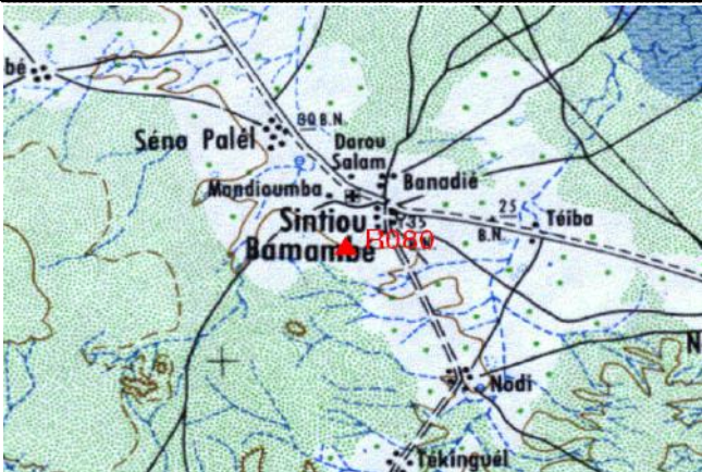
Cartographie 1:200.000 : Matam

Description: Sintiou Bamambé, repère bronze de la borne OMVS n° 32 a droit de la piste vers Sintiou Bamambé.