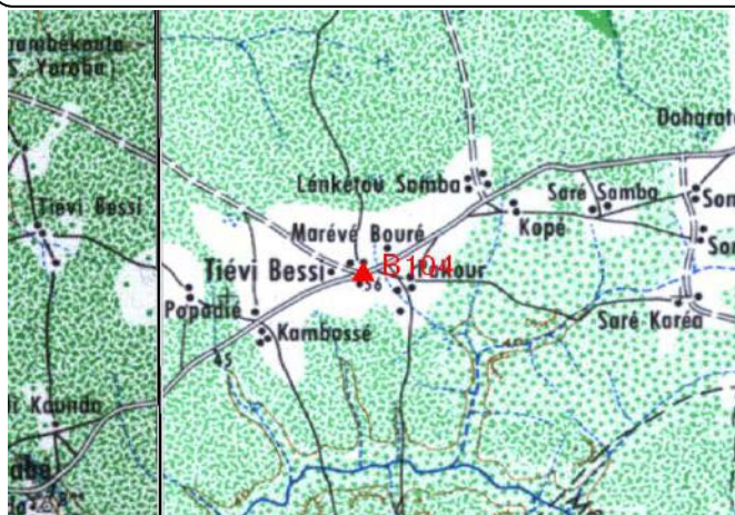
Cartographie 1:200.000 : Youkounkoun

Papa Sy Adyef Shrafet Pakun Tel 3144185 Fixe 9973601