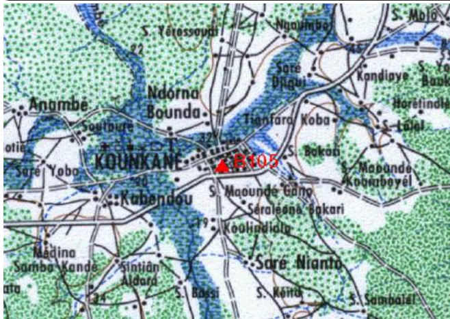
Cartographie 1:200.000 : Kolda