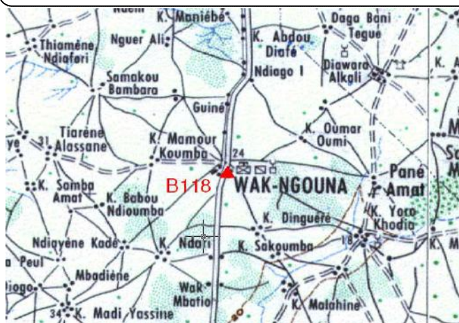
Cartographie 1:200.000 : Sokone

Description: Wak Ngouna, borne béton située au Sud Ouest du CEM