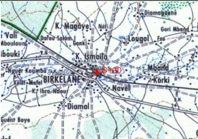
Cartographie 1:200.000 : Kaffrine

Description: Birkelane, borne béton située dans l'angle Ouest de l'enceinte de l'école à gauche de l'entrée