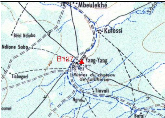
Cartographie 1:200.000 : Linguère

Description: Yang Yang, borne béton située à l'arrière de la Sous-Préfecture Chef: Ibahima Diano Kèbè Tel. 775557683 Fixe 339688000