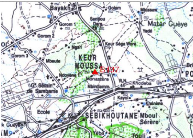
Cartographie 1:200.000 : Dakar

Description: Keur Moussa, borne béton située au carrefour à l'entrée du monastère