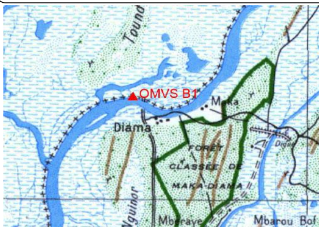
Cartographie 1:200.000 : St-Louis

Description: Barrage Diama, repère en bronze sur borne OMVS B1 située sur terre-plein du barrage