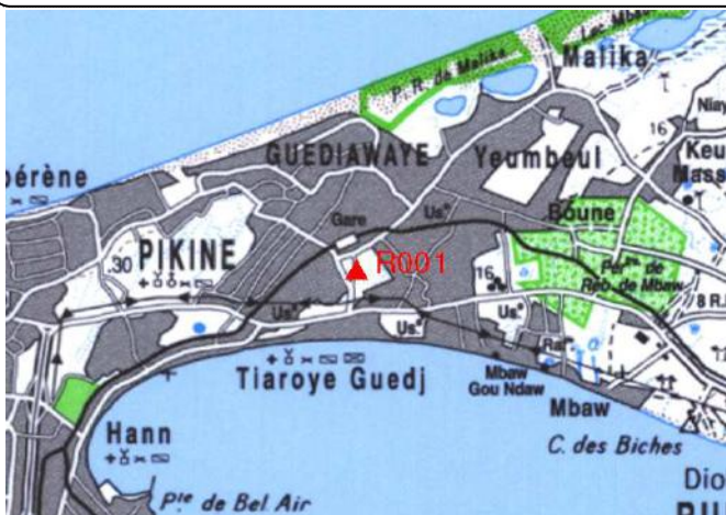
Cartographie 1:200.000 : Dakar

Description: Dakar, Hôpital de Pikine repère scellé sur l'angle du trottoir sur la promenade en face de l'hôpital.