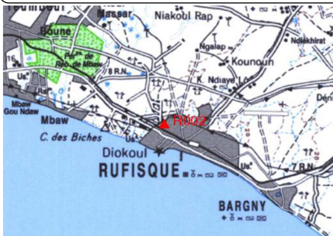
Cartographie 1:200.000 : Dakar

Description: Rufisque, repère scellé sur toiture du Centre des Services Fiscaux de Rufisque Bargny (choix du site fait avec l'approbation du chef du service)