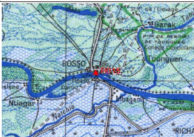
Cartographie 1:200.000 : Dagana

Description: Rosso, repère scellé situé sur ouvrage en béton embarcadère sur le fleuve Sénégal