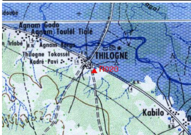
Cartographie 1:200.000 : Matam

Description: Thilogne stade, repère scellé sur le coin Sud du terrain de basket