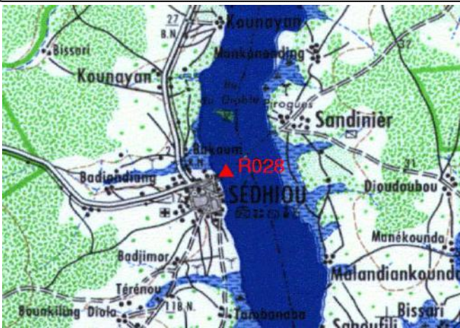
Cartographie 1:200.000 : Sédhiou

Description: Sédhiou, repère scellé situé sur l'angle Nord Ouest de l'embarcadere sur le fleuve Casamance