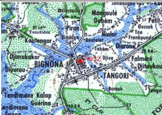
Cartographie 1:200.000 : Ziguinchor

Description: Bignona, repère scellé dans l'angle Sud Ouest du terrain de sport du lycée Ayoune Soné