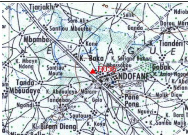
Cartographie 1:200.000 : Nioro

Description: Ndofane, repère scellé dans l'angle Nord Ouest du terrain de sport