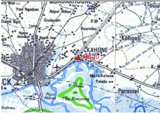
Cartographie 1:200.000 : Thiès

Description: Pont Kahone repère scellé dans parapet béton côté Sud de la Route Nationale 1