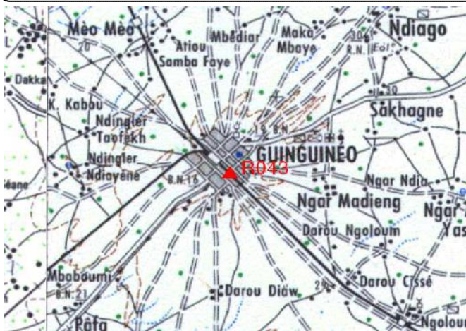
Cartographie 1:200.000 : Kaffrine

Description: Guinguinéo, repère scellé sur bunker côté Est situé le long des rails près du stade de football