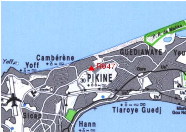
Cartographie 1:200.000 : Dakar

Description: Pikine, repère scellé sur l'angle Nord Est de la toiture du Cadastre