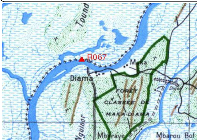
Cartographie 1:200.000 : St-Louis

Description: Diama, repère scellé situé sur le quai côté Sud du barrage sur le fleuve Sénégal