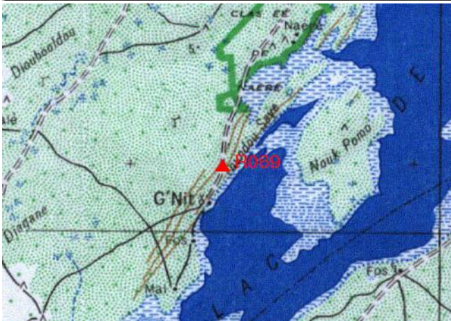
Cartographie 1:200.000 : Dagana

Description: G'Nith, repère scellé sur route d'accès le long de l'ouvrage de l'acqueduc.