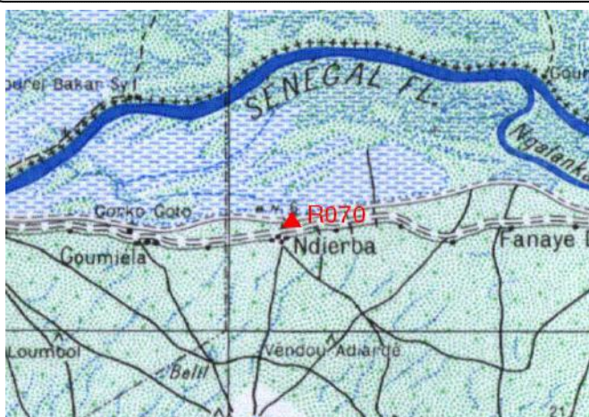
Cartographie 1:200.000 : Dagana

Description: Ndierba, repère scellé sur socle béton du puits en face de l'école élémentaire Mancar Thiam Moustapha Thiam frère du Chef du village Tel. 776436042.