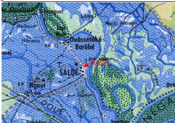
Cartographie 1:200.000 : Kaédi

Description: Saldé, repère scellé dans le socle en béton de l'ancien drapeau devant la Sous-Préfecture Mr. Abdoul Aziz Diagne principal de la Pprefecture Fixe: 9658054 - 6392581