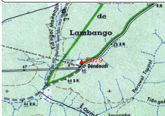
Cartographie 1:200.000 : Matam

Description: Déndoudi, repère scellé dans massaf béton de l'abreuvoir