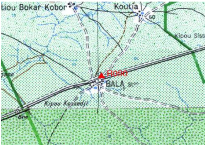
Cartographie 1:200.000 : Bala

Description: Bala, repère scellé dans socle béton situé à l'Est du terrain de sport et au Nord des rails