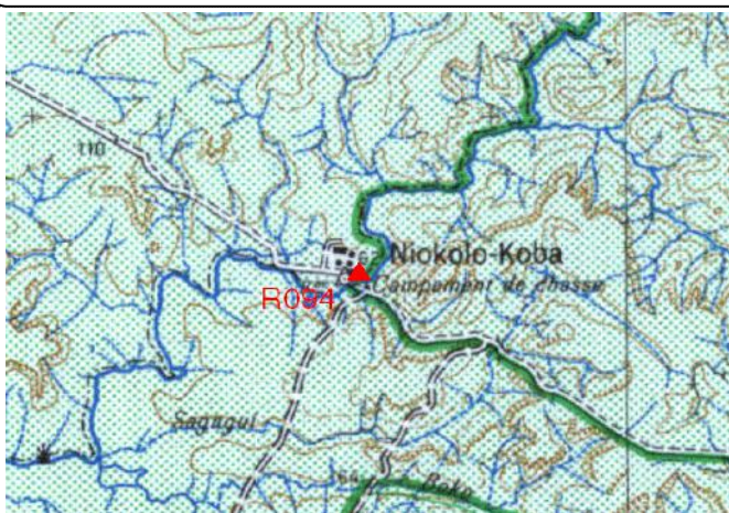
Cartographie 1:200.000 : Dalafi

Description: Niokolo Koba, repère scellé sur trottoir sur pont du fleuve sous la RN7