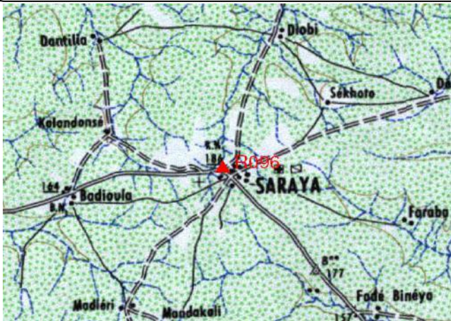
Cartographie 1:200.000 : Kéniéba

Description: Saraya, repère scellé côté Est du terrain de sport