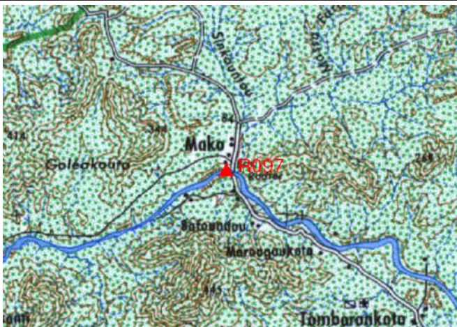
Cartographie 1:200.000 : Kédougou

Description: Mako, repère scellé sur début du trottoir Sud Est du pont sur la Gambie sous la RN7