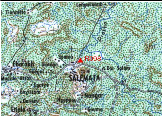
Cartographie 1:200.000 : Kédougou

Description: Salémata, repère scellé dans l'angle Nord Ouest sur dalle béton d'une citerne d'eau de l'école CEM