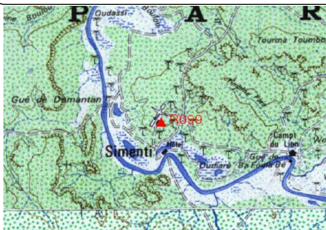
Cartographie 1:200.000 : Tamba

Description: Simenti, repère scellé dans massif béton de la station météo de l'aéroport