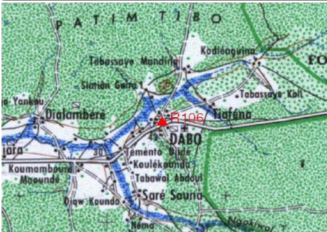
Cartographie 1:200.000 : Kolda

Description: Dabo, repère scellé dans socle béton du drapeau de la Sous-Préfecture Mamadou Moustaphà Thiandoum le prefect Tel. 339967001 Fixe 5502248