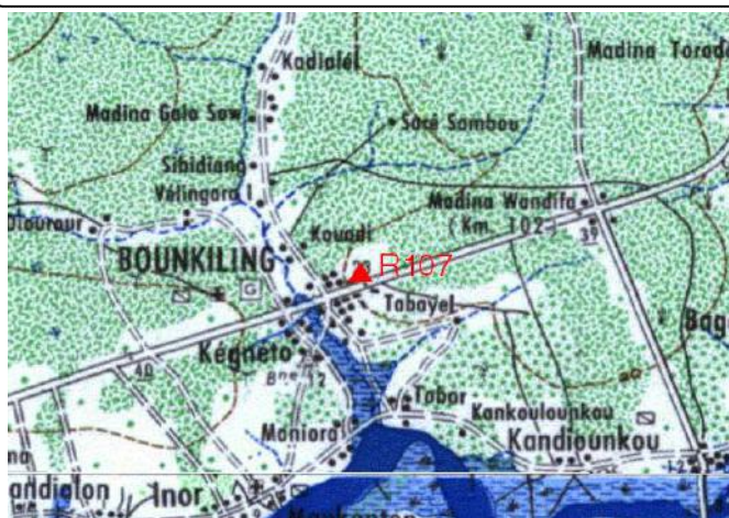
Cartographie 1:200.000 : Niore

Description: Boukiling, repère scellé dans socle béton du drapeau du lycée