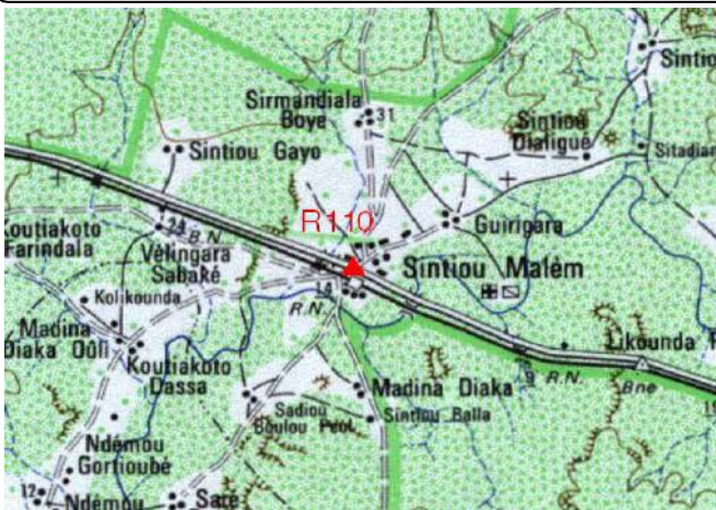
Cartographie 1:200.000 : Tamba

Description: Sintiou Malèm, repère scellé dans mur de soutènement du terre-plein de l'ancienne gare ferroviaire