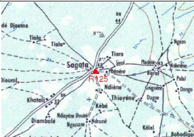
Cartographie 1:200.000 : Linguère

Description: Sagata, repère scellé dans socle béton du plot béton Sud Est à l'entrée de la ville