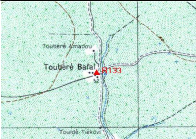
Cartographie 1:200.000 : Bala

Description: Toubéré Bafal, repère scellé dans socle Nord en béton de l'antenne SONATEL