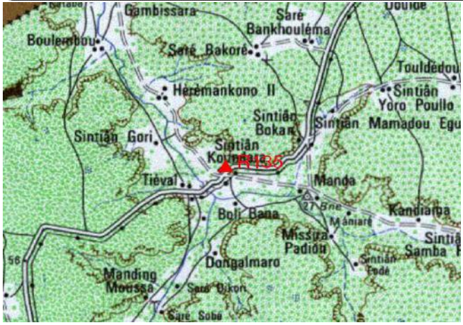
Cartographie 1:200.000 : Tamba

Description: Sintian Koundara, repère scellé dans dalle béton puits