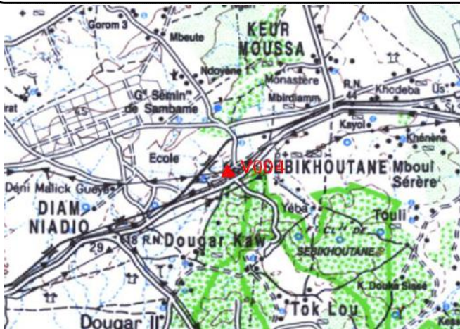
Cartographie 1:200.000 : Dakar

Description: Sebikhoutane, repère à vis scellé sur le 2ème pillier à gauche de l'entrée de la mairie