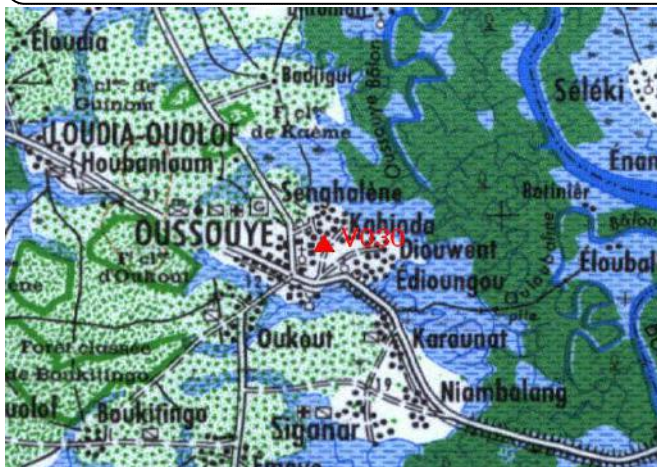
Cartographie 1:200.000 : Ziguinchor