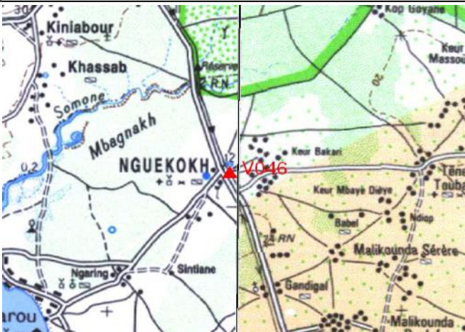
Cartographie 1:200.000 : Dakar

Description: Nguekokh, repère à vis sur le pillier de gauche de l'entrée piéton de l'Hôtel de Ville Tel. 9577735