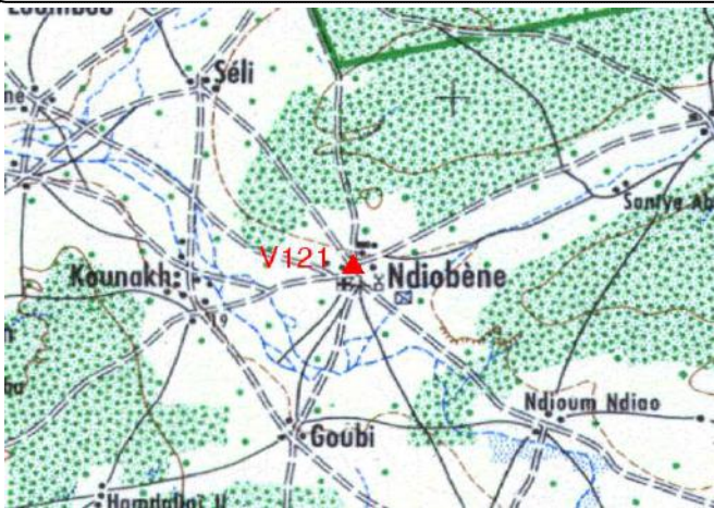
Cartographie 1:200.000 : Kaffrine

Description: Ndiobène, repère à vis situé dans l'angle Nord sur le mur d'enceinte du foyer rural